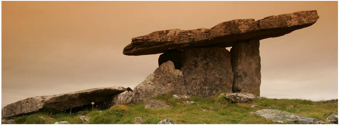
POULABRONE DOLMEN - 5000 JAHRE ALTES MEGALITHGRAB

Als wir die Poulabrone Dolmen erreicht hatten, waren die Tröpfchen auf dem Auto schon fast wieder abgetrocknet.