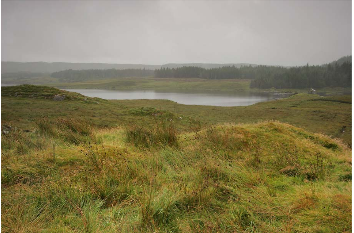
ERSTE, REGNERISCH-TRÜBE EINBLICKE IN DAS WILDE CONNEMARA IM COUNTY GALWAY