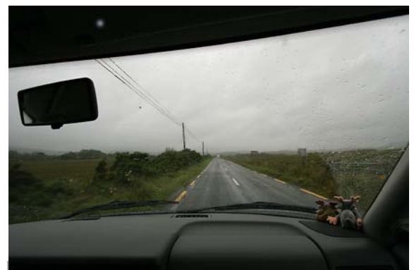
TRÜBE AUSBLICKE BEI DER FAHRT NACH CONNEMARA ...