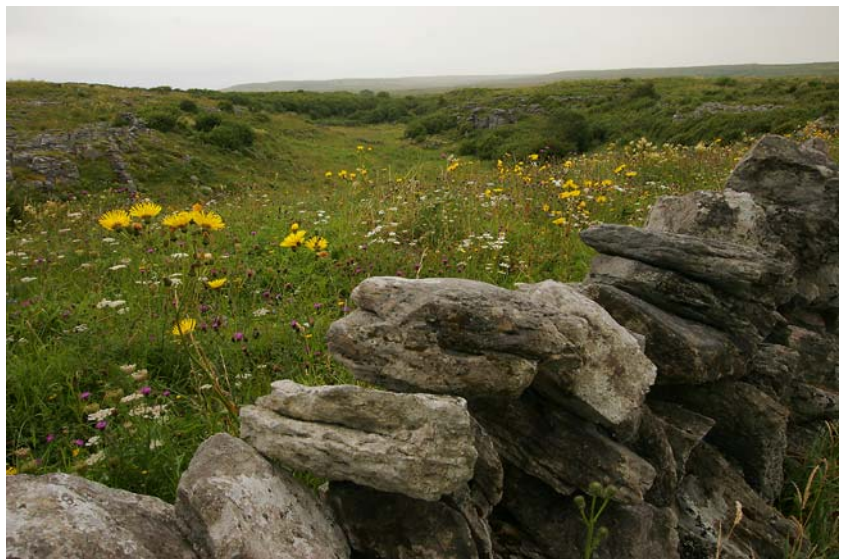
STEINMAUER IM NICHTS (BURREN, NÄHE POULNABRONE)

selbst dann haben es die Iren geschafft, die Steine aus dem Boden zu holen und damit fast allgegenwärtige Steinmauern zu errichten - für die zahlreichen Kühe und weniger zahlreichen Schafe und die noch seltener vorkommenden Getreidefelder