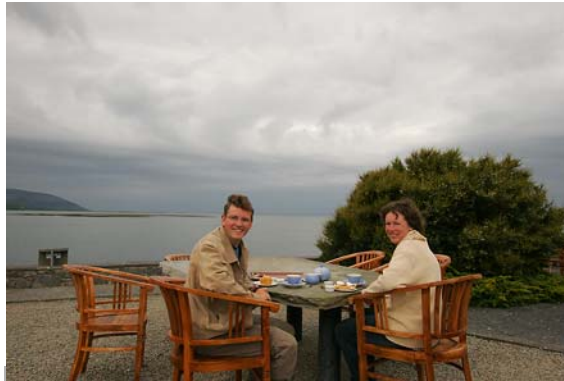
DIE EINZIGEN GÄSTE IM GARTEN DES BURREN HOUSE

Alles mit 2 x 1.4 x 1.6 x 300mm = 1344mm Brennweite (auf Kleinbild bezogen).