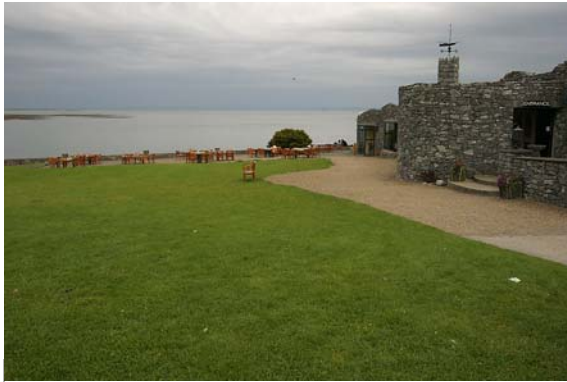
BURREN EXPOSURE - AUSSTELLUNG, RESTAURANT UND SHOP