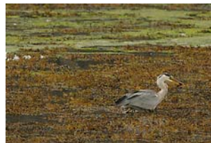
ERFOLGREICHER FISCHZUG EINES GRAUREIHERS (ARDEA CINEREA)

Dafür sind die Bilder gar nicht mal so schlecht geworden ... Hauptsache, der jahrelange Spaß um Reiher, die vor mir und meiner Kamera fliehen, ist ausgestanden.