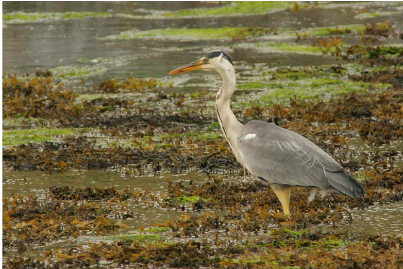
GRAUREIHER, GREY HERON (ARDEA CINEREA), ODER IRISCH CORR RIASC

gestern beim Kurzbesuch möglich gewesen wäre.