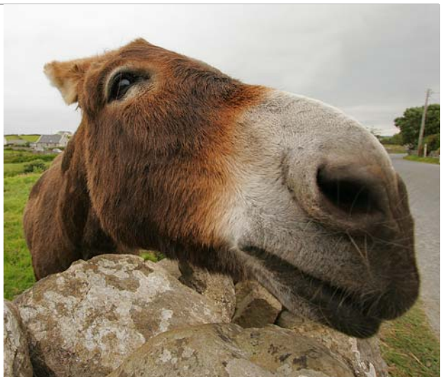
ESEL, FRÜHER WICHTIGES TRANSPORTMITTEL, SIND IMMER NOCH HÄUFIG ANZUTREFFEN