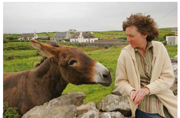
VERSTÄNDNIS OHNE WORTE

gebaut und drei Bäume gepflanzt, sowie diese Zeilen geschrieben.