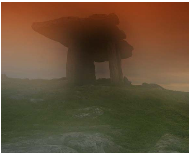
POULABRONE DOLMEN IM MYSTIC STYLE

> Burren House (Burren Exposure), Ballyvaughan